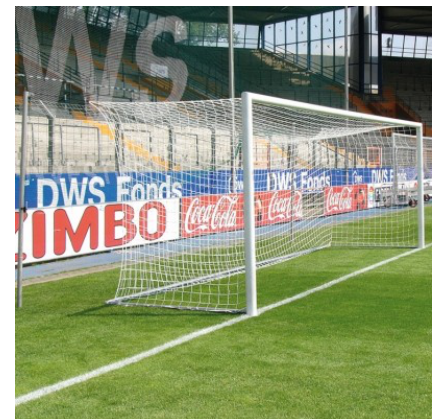
freie Netzaufhängung am Beispiel des Großfeldtores Modell „S“ (Art.Nr.: B700-FRN-R17)

Diese, mit Hilfe der Karabinerhaken, in das lange Drahtseil an der Tornetzecke einhängen. Das andere Ende der kurzen Drahtseile in das Spannschloß am Stahlmast hängen und spannen.